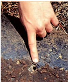
Typische Perforation einer unzureichend vor Streuströmen geschützten Kanalisation.

Polyurethanbeschichtungen (PUR) bieten höchste Qualität